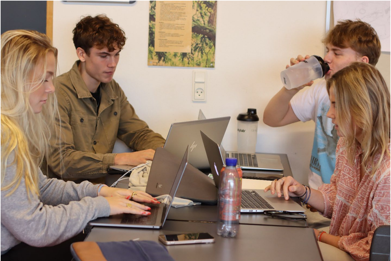
Koncentration og vand skal der til i SRP